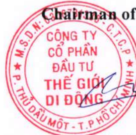
NGUYEN DUC TAI