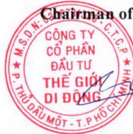
NGUYEN DUC TAI